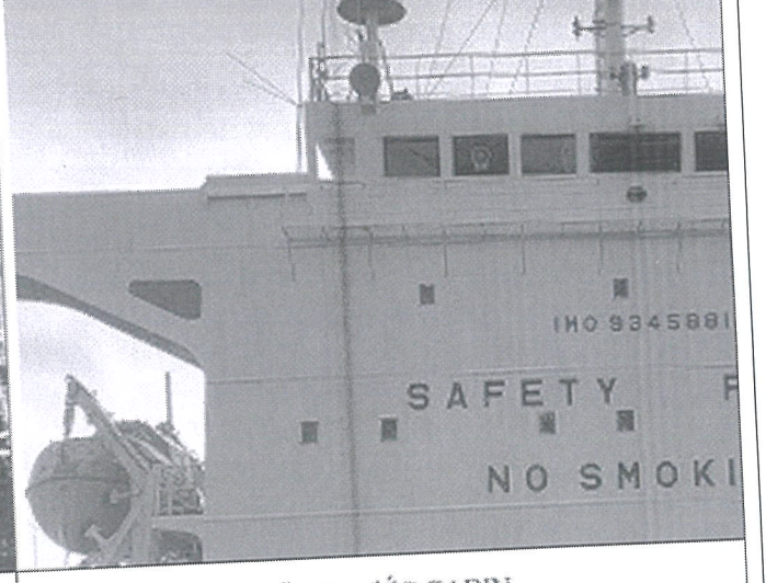
MẶT BOONG TỔNG THỂ NHÌN TỪ BUÔNG LÁI